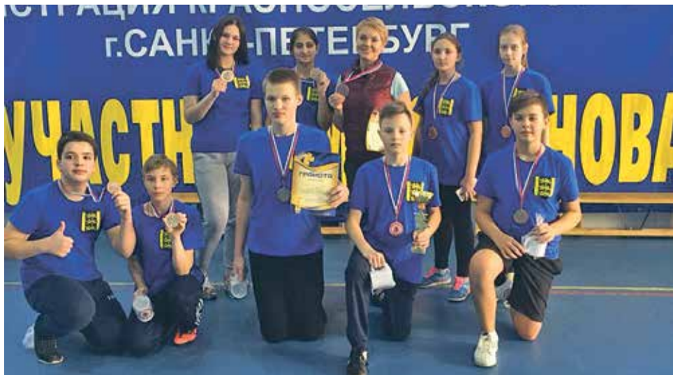
В команде МО Горелово по пионерболу ученики школы № 398

Команды-победительницы и призеры соревнований награждены кубками, грамотами, медалями соответствующих степеней. Все участники награждены памятными призами.