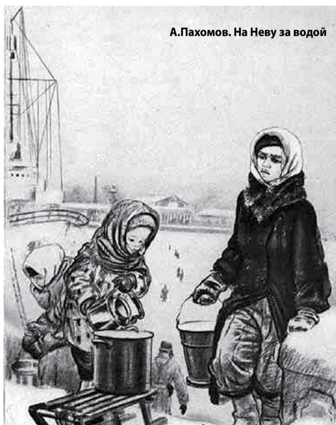
А.Пахомов. На Неву за водой